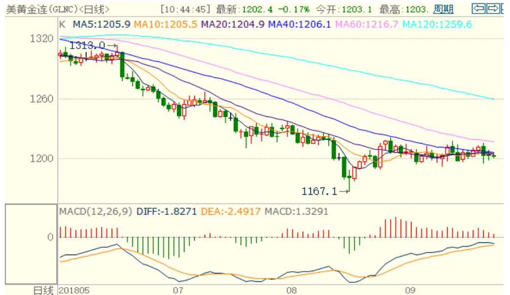
图 1：COMEX 黄金主力合约技术分析

COMEX 黄金上周在 1200 美元/盎司附近震荡，技术指标偏中性，预计 FOMC 会议前黄金仍将围绕 1200 震荡，会议期间可能有所上涨。