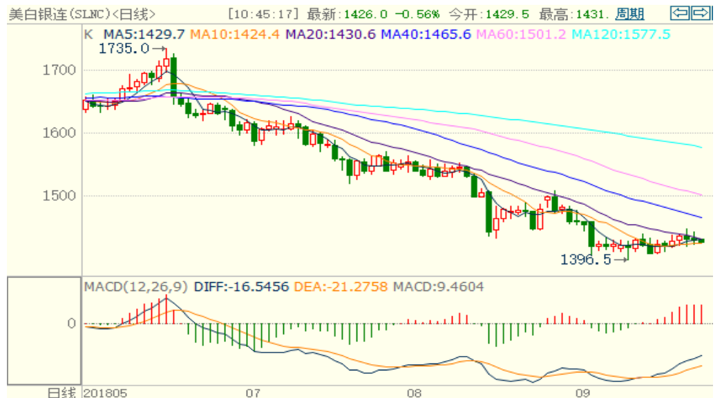
图 2：COMEX 白银主力合约技术分析